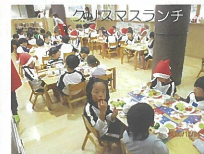
クリスマスランチ